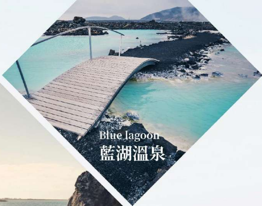
Blue lagoon 藍湖溫泉