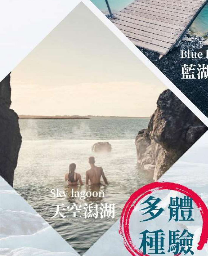
Sky lagoon 天空瀉湖